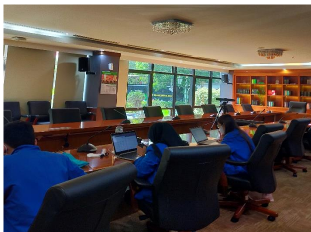
Mengerjakan tugas yang diberikan Mentor/ Staff