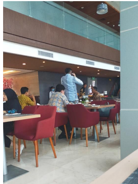
Menghadiri penutupan acara “Penilaian Kinerja jabatan fungsional pranata peradilan melalui aplikasi kepegawaian kepaniteraan periode Juli-Desember 2022”