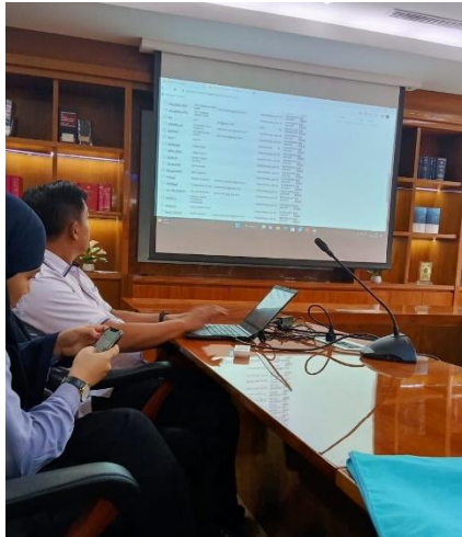
Pemberian arahan tata cara upload putusan pada website direktori putusan