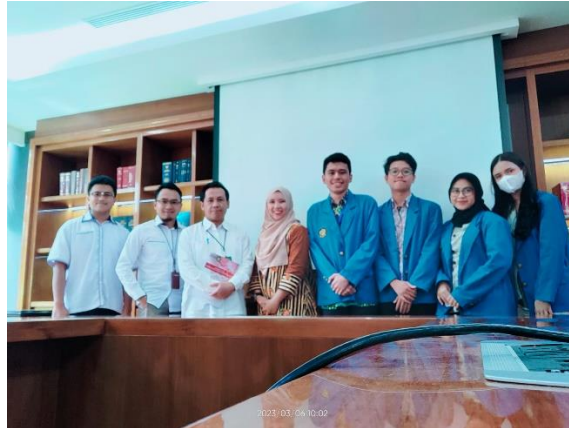
Penyerahan Mahasiswa Magang kepada mentor di Mitra Magang