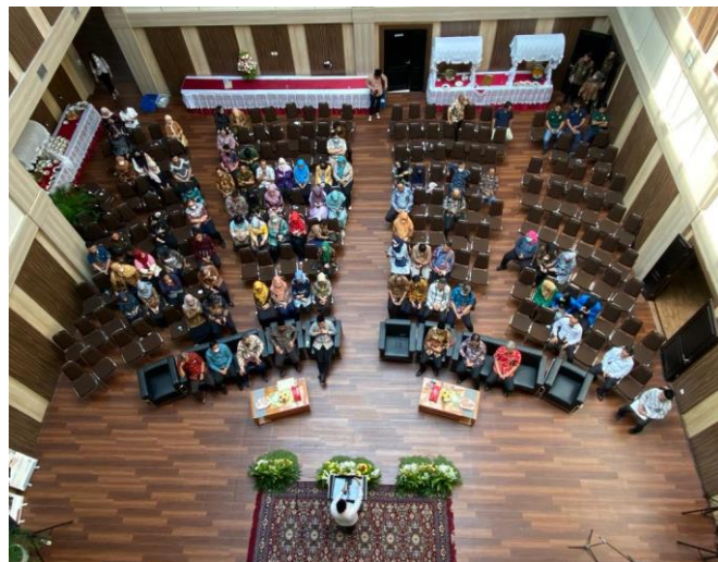
Mengikuti acara Munggahan menjelang bulan Ramadhan