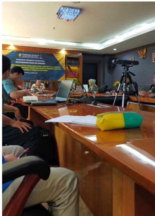
Mengikuti Focus Discussion Group perihal administrasi upaya hukum dan persidangan perkara kasasi dan peninjauan kembali secara elektronik